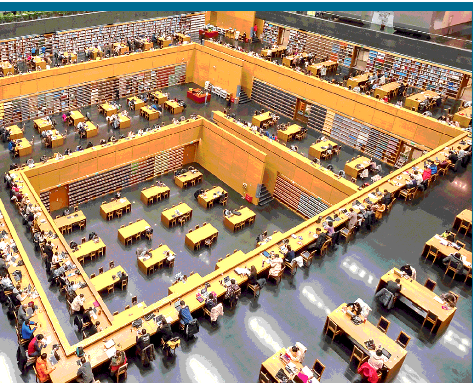
Biblioteca nazionale della Cina Pechino