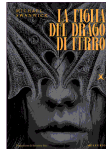
Michael Swanwick "La figlia del drago di ferro" (trad. di Susanna Bini) Mercurio pp. 400, € 19

L'elemento meccanico-postindustriale, tuttavia, non è l'unico fattore di rottura rispetto al fantasy canonico. Una volta fuori dalla fabbrica-prigione, per Jane si spalancano altre sfide da affrontare. La dipendenza dal drago, ad esempio, a cui è intimamente legata da un sentimento di devozione e repulsione. O il nuovo ambiente in cui è immersa, dove una Jane ormai adolescente incontra nuove amicizie, dietro le quali si cela tuttavia qualcosa di antico. E così neanche troppo gradualmente – il romanzo di Swanwick procede per scarti piuttosto netti – Jane deve fare i conti con la violenza e la corruzione anche al di là del muro, passando attraverso riti di passaggio a tinte esoteriche e ampie concessioni a una sessualità piuttosto spinta. Il risultato è un viaggio che continua a spiazzare e interrogare i lettori, costretti a interrogarsi sui significati più reconditi del romanzo come fosse appena terminata la visione di un film di David Lynch. —